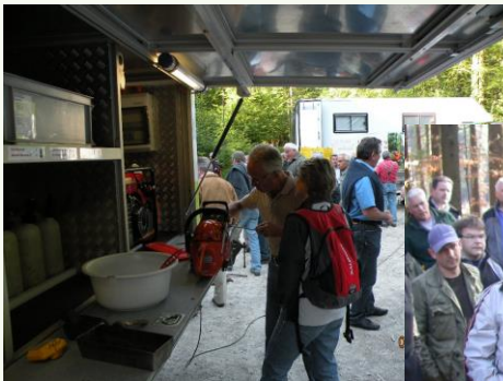
Mutige üben schon mal das schärfen der Motorsägekette

Kleine Instruktionen wecken das Interesse