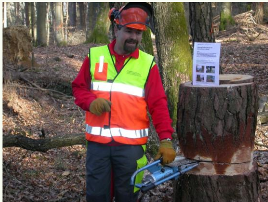
Vorstellung des hydraulischen Keils