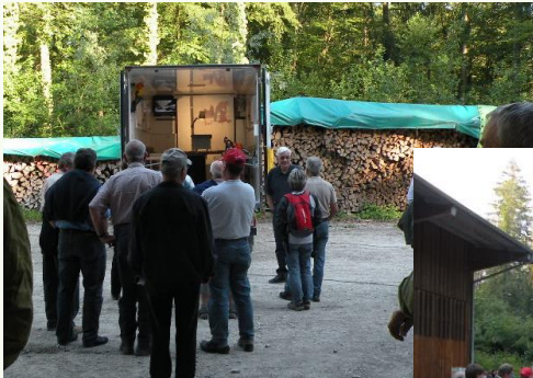
Die Lehrfilme sind begehrt.

Das Mobi eignet sich auch als Präsentationswand