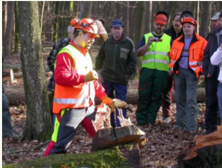
An Hand von Stockbildern wird die Fällmethode vorgestellt

Vor dem Fällschnitt kann die Vorbereitungsarbeit begutachtet werden